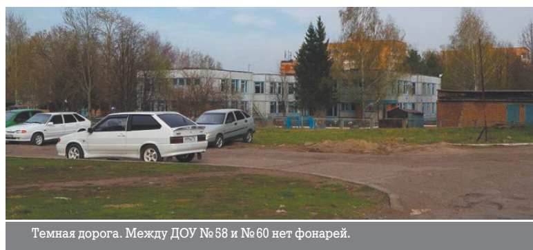
Темная дорога. Между ДОУ № 58 и № 60 нет фонарей.

И еще одна хорошая новость про дороги, которая была озвучена на встрече. Ремонт дорог в садоводческих массивах будет продолжен и дойдёт до дамбы на Красном Ключе.