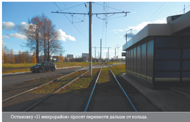
Остановку «11 микрорайон» просят перенести дальше от кольца.

Пока о строительстве приюта говорить рано, но уже запланировано возведение площадки для выгула собак.